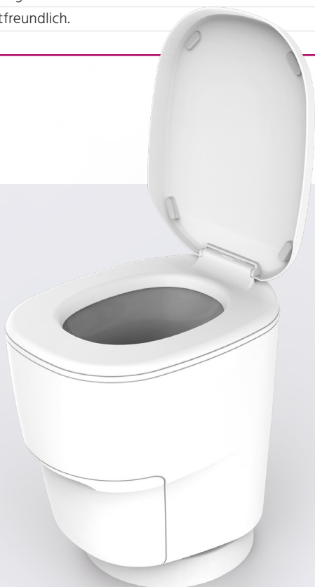
Clesana C1 mit Rund-Sockel zur freien Platzierung im Raum